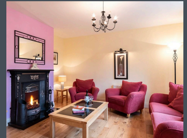
Gemütliches Wohnzimmer mit offenem Kamin