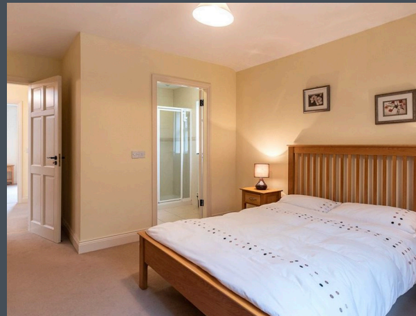
Schlafzimmer mit Doppelbett, Bad/WC en suite