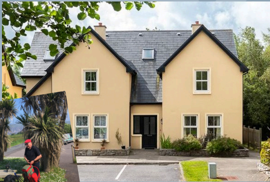
re.: Neidin Cottage li.: Dingle Way bei Clogher Head

(5 Betten, 1 Kinderbett), Salon mit Kamin, Küche mit Esszimmer, 2 Badezimmer und ein Gäste-WC. Sitzecke im nach Süden gelegenen Garten. Waschmaschine / Trockner. Breitband W-LAN