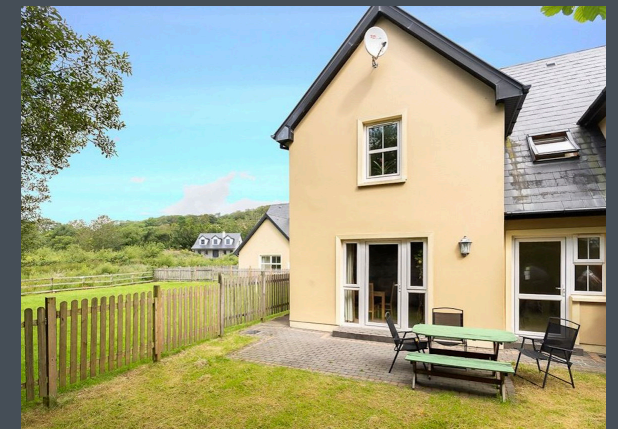
Sitzplatz im nach Süden gelegenen Garten (ab 2021 mit Pergola)